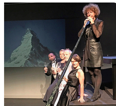
Eine Liebesbekundung.