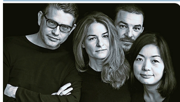
Streichquartett aus Zürich.

Galatea String Quartet Matinee-Konzert mit der Uraufführung des Streichquartetts «In Another Country» des Zürcher Komponisten Flavio Motalla sowie Werken von Beethoven und einer Auswahl an argentinischen Tango-Stücken.