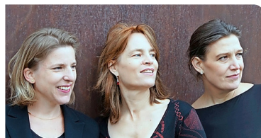
Das Absolut Trio.

Datum: So, 12.9., 17 Uhr www.ensemble2010.ch